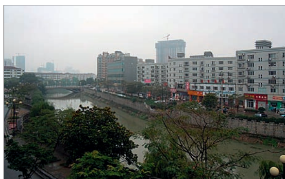
6. Vista di Suqian.