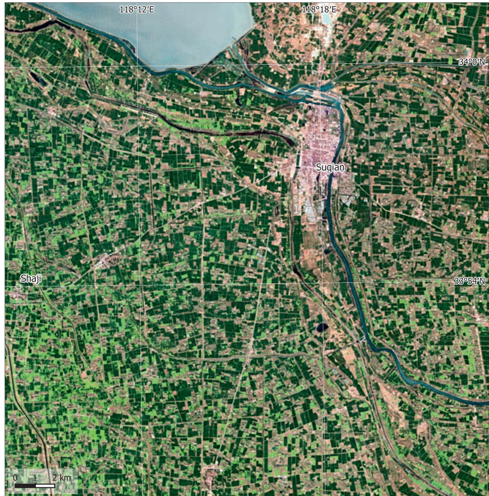
8. Suqian, Chine, en 1987. Données : Landsat 4, 1984-04-21.