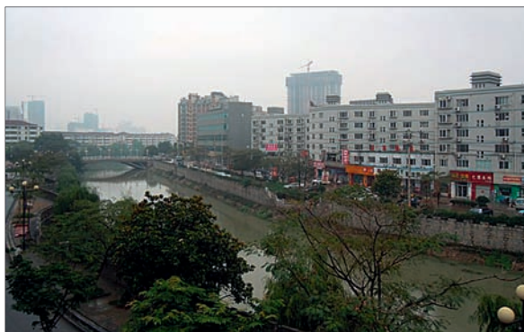
6. Vue de Suqian.

Dans le contexte d'une croissance rapide, Suqian s'est engagée en faveur du développement durable et d'initiatives écologiques. La ville a compris l'établissement d'une couverture forestière de plus de 800 kilomètres carrés et l'adoption de sources d'énergie renouvelables, qui répondent à 30 % de ses besoins énergétiques. Les efforts de planification urbaine ont déjà permis de réduire les niveaux de pollution et d'augmenter les espaces verts.