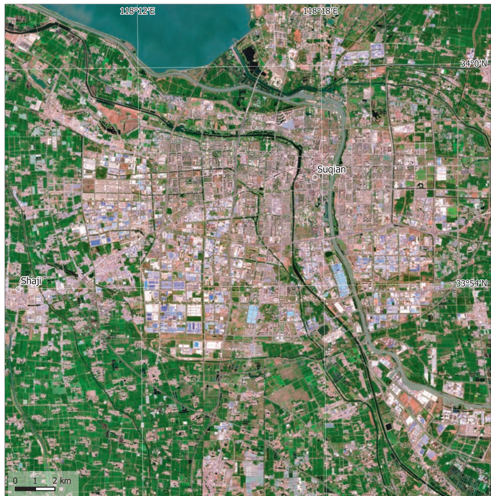
9. Suqian, Chine, en 2023. Les zones résidentielles, commerciales et industrielles ont remplacé une grande partie des terres agricoles. Données : Sentinel-2, 2023-04-16.