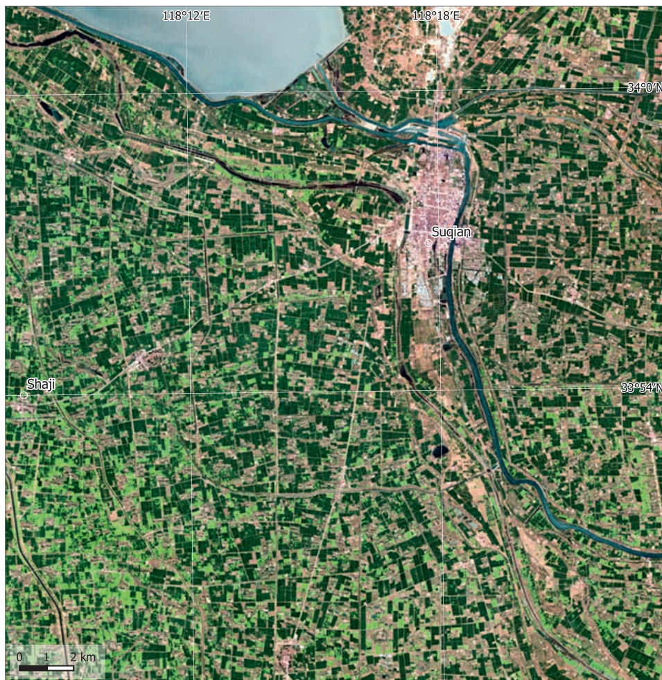
8. Suqian, China, en 1987. Datos: Landsat 4, 21/04/1987.