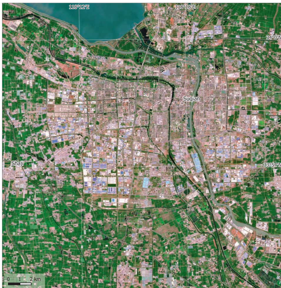
9. Suqian, China, en 2023. Las zonas residenciales, comerciales e industriales han desplazado gran parte de las tierras agrícolas. Datos: Sentinel-2, 16/04/2023.