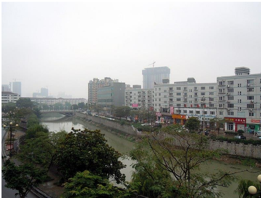
Vue de Suqian (photographie : Sinopitt Xu).