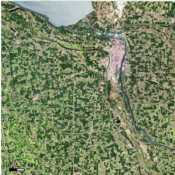
Suqian, 1987 (Landsat 5)