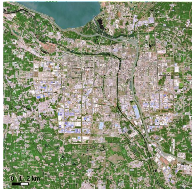
Suqian, 2023 (Sentinel-2)